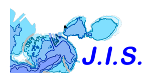
Tavola: AR_04 Scala 1:5000 Luglio 2021

Jonic Integrated Systems Engineering & Construction Via G. Oberdan, 127 - 74121 Taranto - Italy Tel. (+39) 99 4793048 - Mob. (+39) 380 436972 E-mail: jonicintegratedsystems@gmail.com Pec: jiospec.it