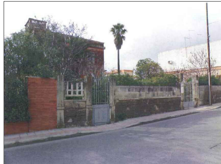
(1) Ingresso principale - C.so Vittorio Emanuele III