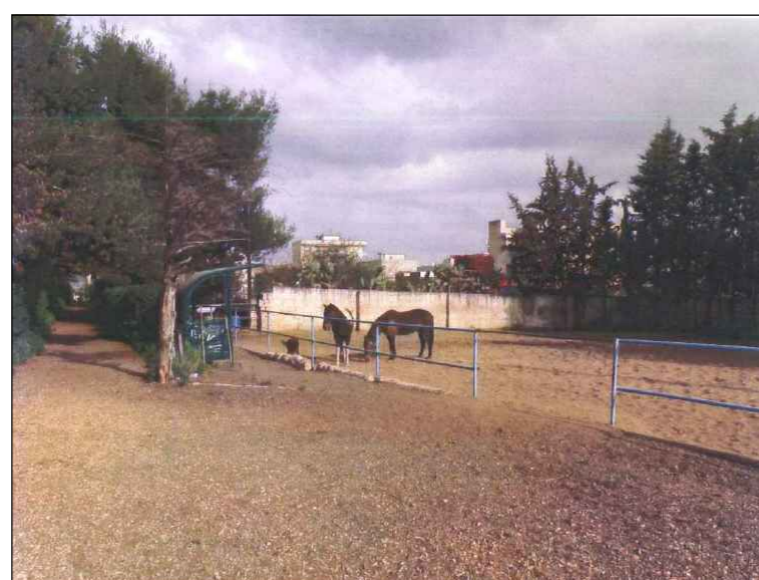
(6) Area giardino posteriore