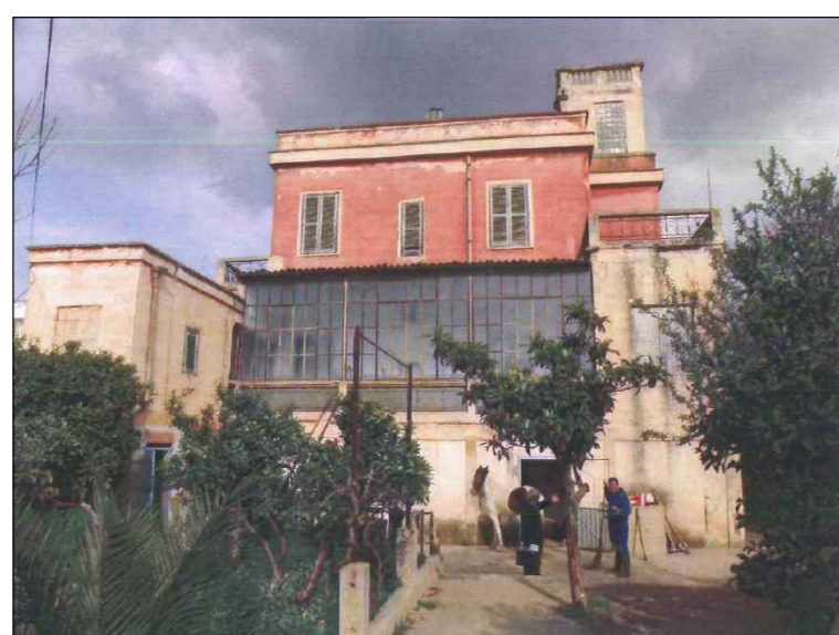
(3) Prospetto Ovest (posteriore)