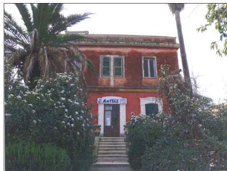
(2) Prospetto Est principale