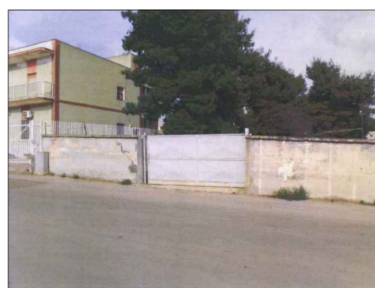
(7) Ingresso secondario - Via delle sorgenti