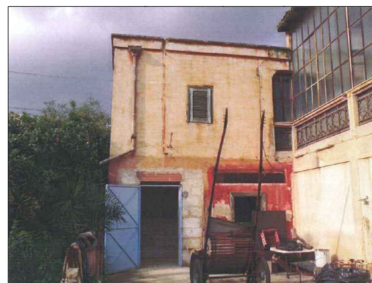
(4) Area posteriore