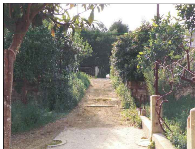
(5) Vialeto giardino posteriore