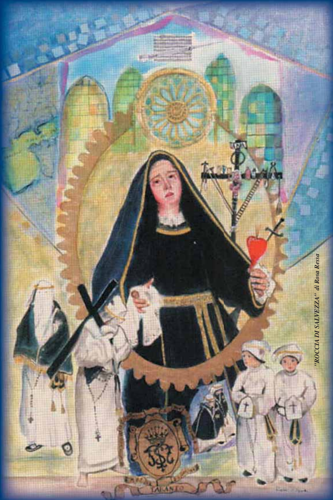
"ROCCIA DI SALVEZZA" di Rosa Ressa

L'amministrazione comunale di Statte augura a tutti voi una felice Pasqua 2008