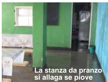
La stanza da pranzo si allaga se piove