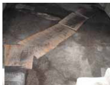
Per entrare nella sala da pranzo i ragazzi devono passare su un pavimento stretto