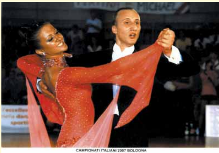
CAMPIONATI ITALIANI 2007 BOLOGNA

qualche kermesse particolare. Sono bravi e ambiscono a diventare insegnanti professionisti di danza sportiva. Litigano,