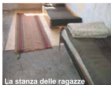
La stanza delle ragazze