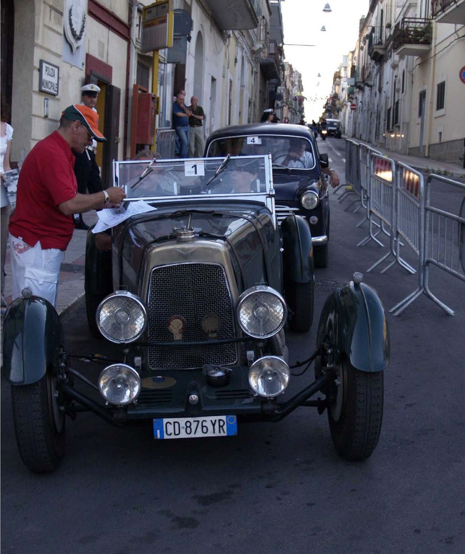
XIV Edizione della "TARANTO STORICA" , a Statte sostano le auto storiche per due controlli a timbro. La manifestazione, valida per il Campionato Nazionale di regolarità è organizzata dalla Pro Motor Sport Taranto