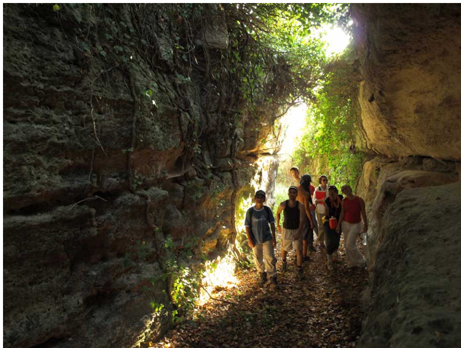
Alcuni momenti del campo. Nelle foto: il rilievo del frantoio ipogeo di Todisco, l'Incassata, l'esplorazione di un ramo ipogeo del Triglio, la Grotta di Leucaspidi.

Foto, resoconti e documentazione sul Campo-Laboratorio sono disponibili nel sito www.novelune.eu .